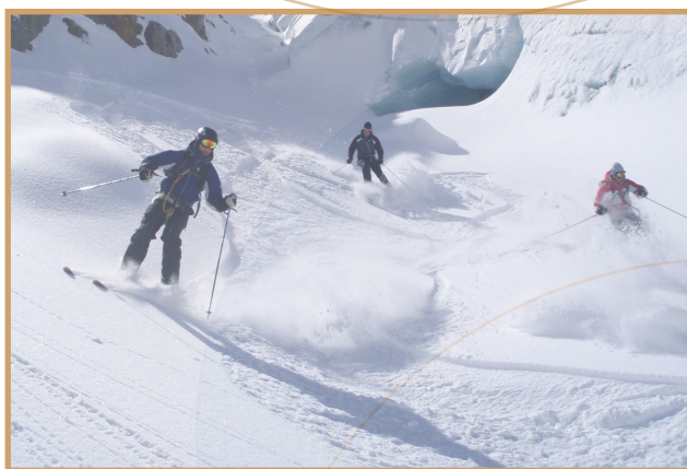
Descente hors piste de la Vallée Blanche